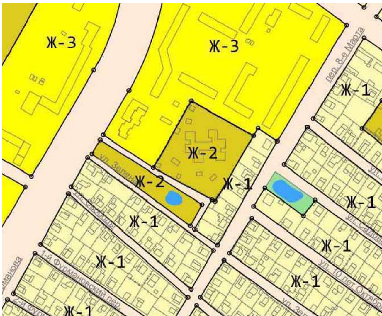
Схема обозначения на карте градостроительного зонирования части территории территориальной зоны малоэтажной смешанной жилой застройки (Ж-2) по ул. Зеленая - зоной рекреационно-ландшафтных территорий и защитных зеленых насаждений (Р-3).