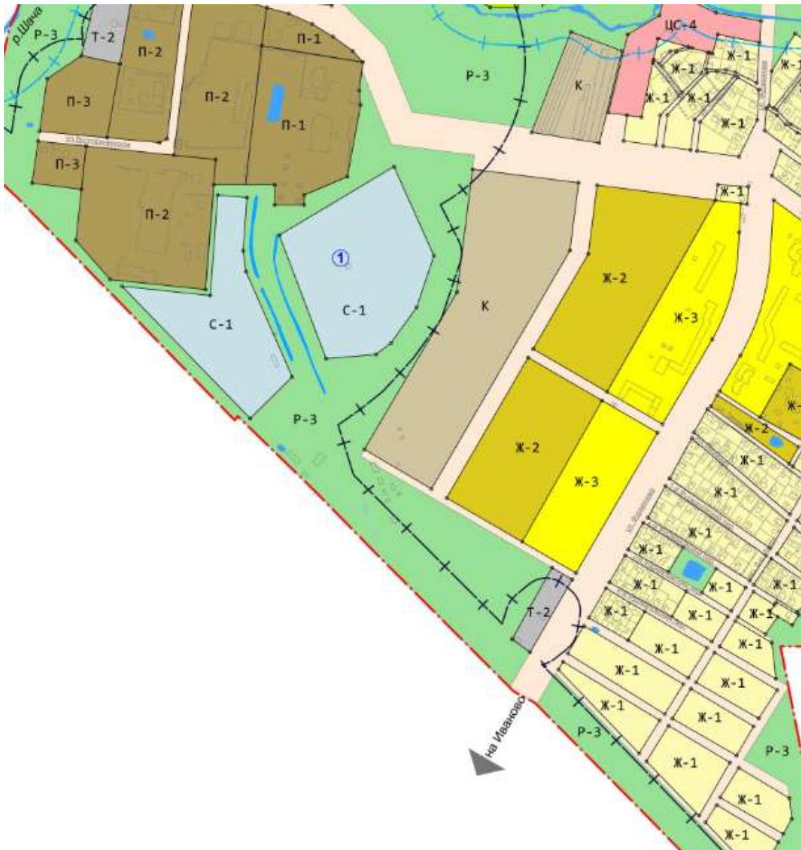
Схема обозначения на карте градостроительного зонирования части территории в территориальной зоне рекреационно-ландшафтных территорий и защитных зеленых насаждений (Р-3) по ул.Фурманова - зоной коммунально-складских объектов (К)