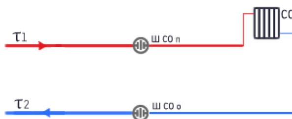
Рисунок 1.3.16.1 - Схема подключения потребителей с непосредственным присоединением системы отопления

В Ингарском сельском поселении все потребители подключены к системе теплоснабжения по зависимой схеме.